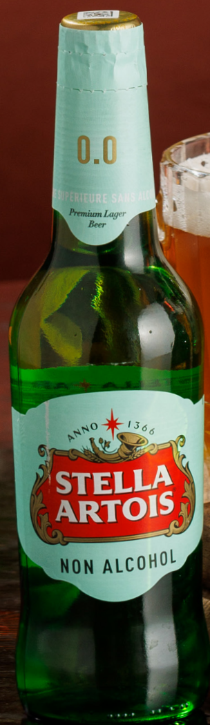
Стелла Артуа безалкогольное